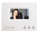
330651 Videocitofono aggiuntivo a colori, viva...