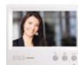
330851 Videocitofono aggiuntivo a colori, viva...